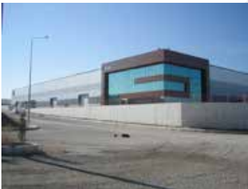
BEŞÇELİK SAC KAPLAMA