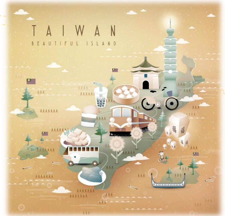
Culture & Standing Buffet