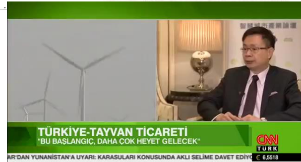
TÜRKİYE-TAYVAN TİCARETİ "BU BAŞLANGIÇ, DAHA ÇOK HEYET GELECEK" CNN TÜRK 6.5518