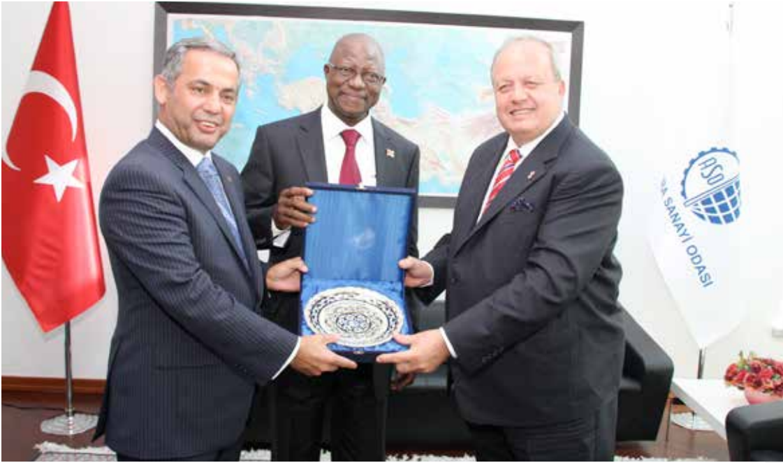
Guinea Bissau Dışişleri Bakanı Sn. Faustino FUDUT 06.09.2012