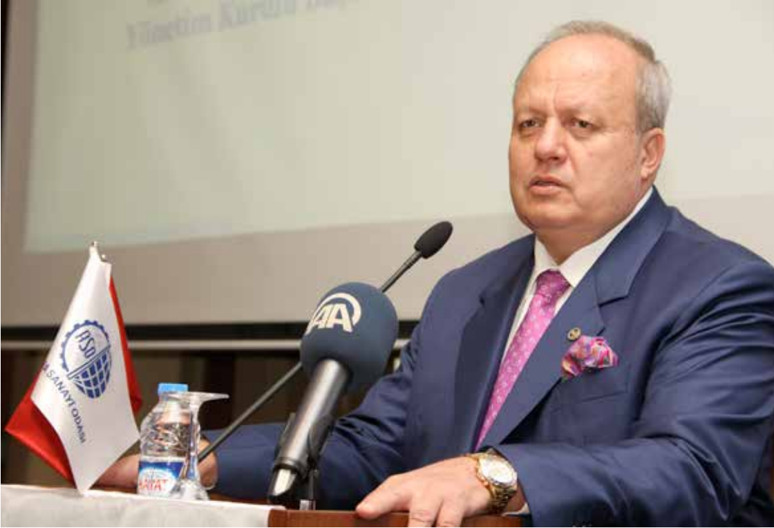
Odamız Yönetim Kurulu Başkanı Sn. Nurettin ÖZDEBİR 13.10.2012