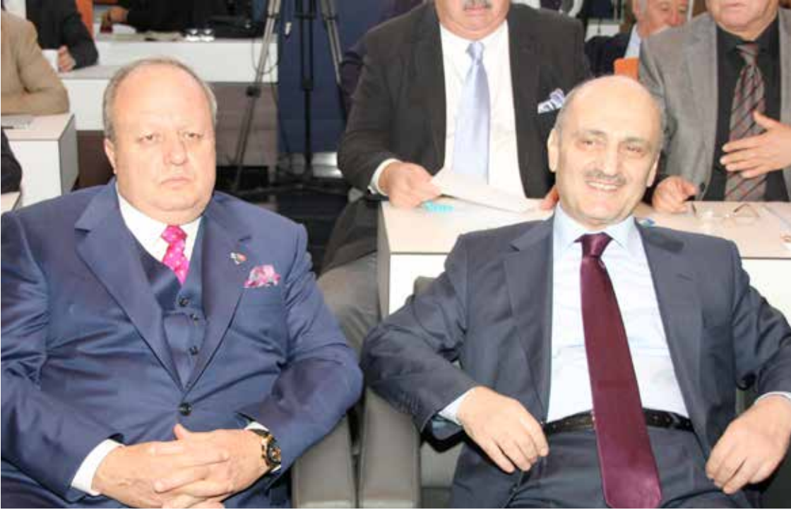
28 Kasım 2012 Çevre ve Şehircilik Bakanı Sn. Erdoğan BAYRAKTAR, 28.11.2012