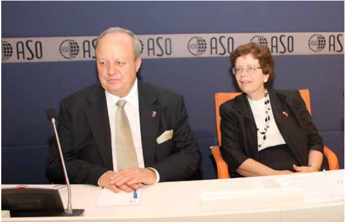
ABD Ticaret Bakan Vekili Sn. Rebecca BLANK