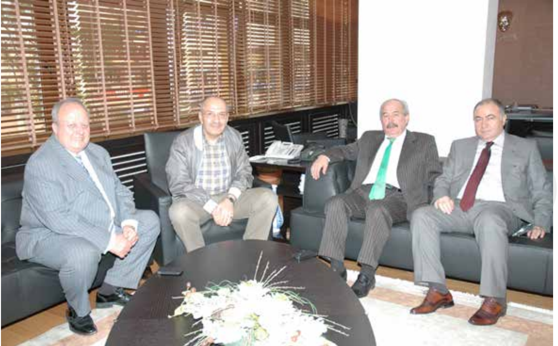
Türk-İş Başkanı Sn. Mustafa KUMLU