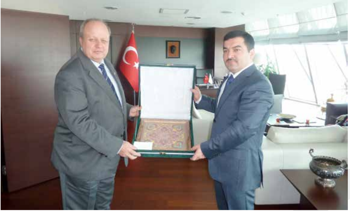
Tacikistan Büyükelçisi Sn. Faruk SHARİPOV