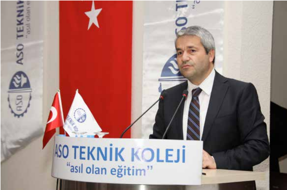
Bilim, Sanayi ve Teknoloji Bakanı Sn. Nihat ERGÜN