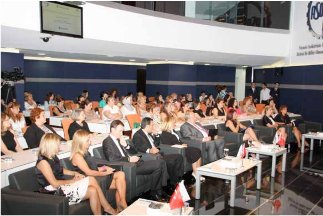
Kadın Girişimci Yönetici Okulu Eğitim Programları Açılış Toplantısı 3.9.2012

Aşağıdaki 15 farklı konuda eğitimlerin düzenlendiği programda 92 katılımcı sertifika almaya hak kazanmıştır.