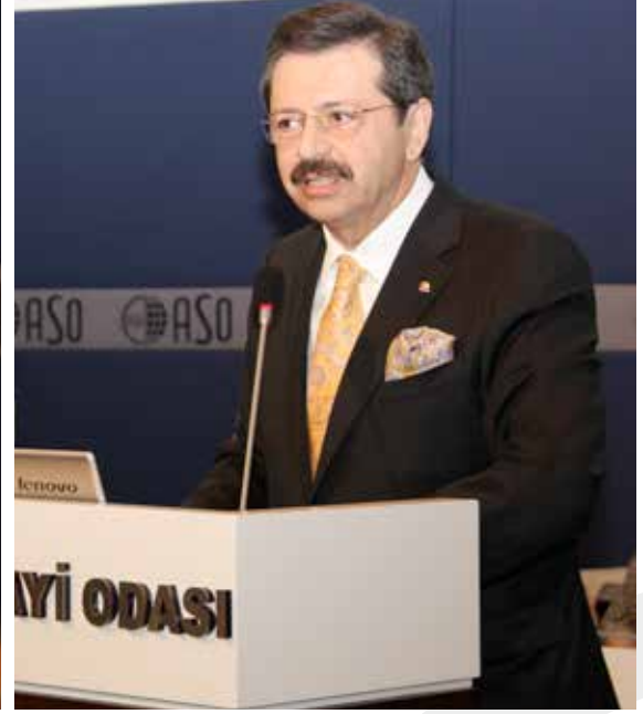
TOBB Başkanı Sn. M. Rifat HİSARCIKLIOĞLU 04.04.2012