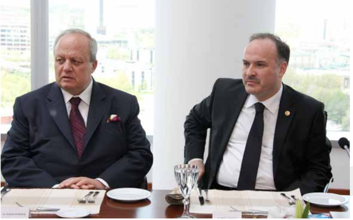
AK Parti Genel Başkan Yardımcısı ve Ankara Milletvekili Sn. Bülent GEDİKLİ