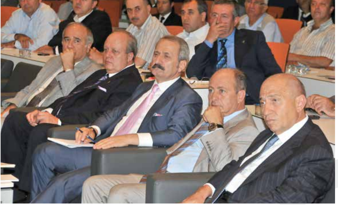
25 Temmuz 2012 Ekonomi Bakanı Sn. Zafer ÇAĞLAYAN, 25.07.2012