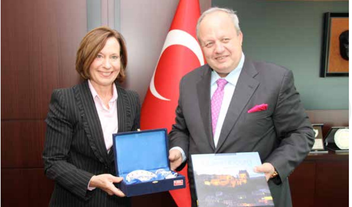
Lüksemburg Büyükelçisi Sn. Arlette CONZEMIUS