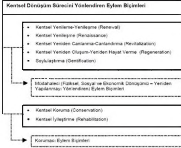
Şekil 1: Kentsel Dönüşüm Sürecini Yönlendiren Eylem Biçimleri

Kaynak: Mustafa Sami DEMİRSOY (2006), "Kentsel Dönüşüm Projelerinin Kent Kimliği Üzerindeki Etkisi (Lübnan - Beyrut - Solidere Kentsel Dönüşüm Projesi Örnek Alan İncelemesi)", Yüksek Lisans Tezi, MSÜ, İstanbul, s.24.