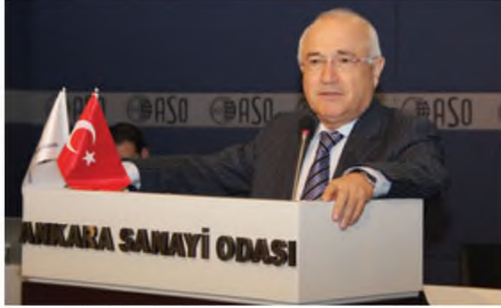
CEMİL ÇİÇEK TBMM BAŞKANI

Sayın Başkan, Ankara Sanayi Odamızın çok değerli Meclis üyeleri, değerli basın mensupları; hepinizi saygıyla selamlıyorum. Fırsat buldukça sizlerle beraber olmaktan da büyük bir mutluluk duyduğumu ifade etmek istiyorum ve bu toplantıya davet sebebiyle de sizlere teşekkür ediyorum.