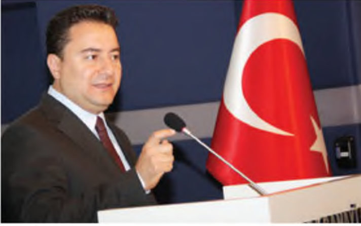
ALİ BABACAN BAŞBAKAN YARDIMCISI

Ankara Sanayi Odamızın çok değerli Meclis Başkanı, çok değerli Yönetim Kurulu Başkanı, Ankara Sanayi Odamızın çok değerli Meclis üyeleri, değerli basın mensupları; hepinizi saygıyla, sevgiyle selamlayarak sözlerime başlamak istiyorum.